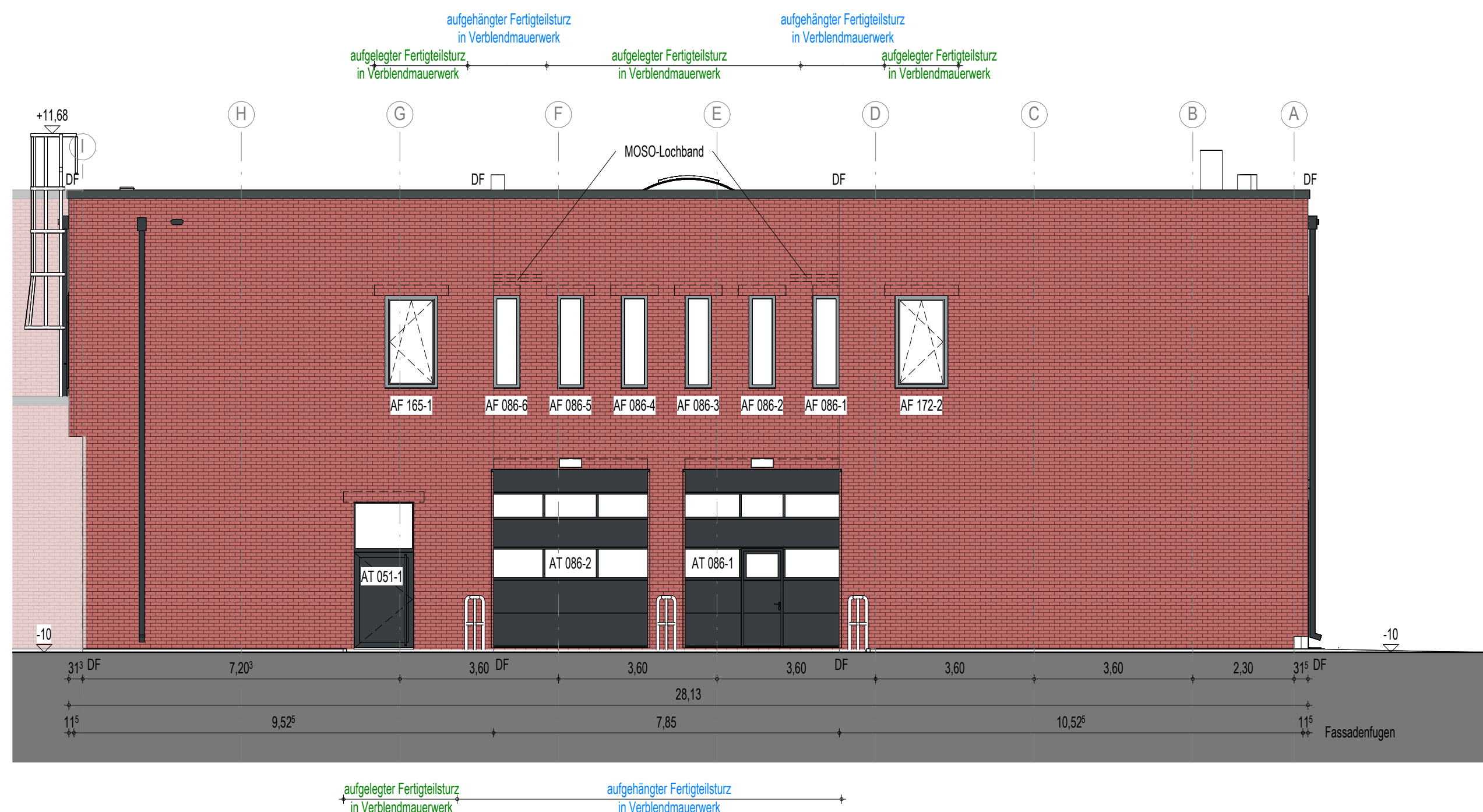
Ansicht BT 2 von Norden