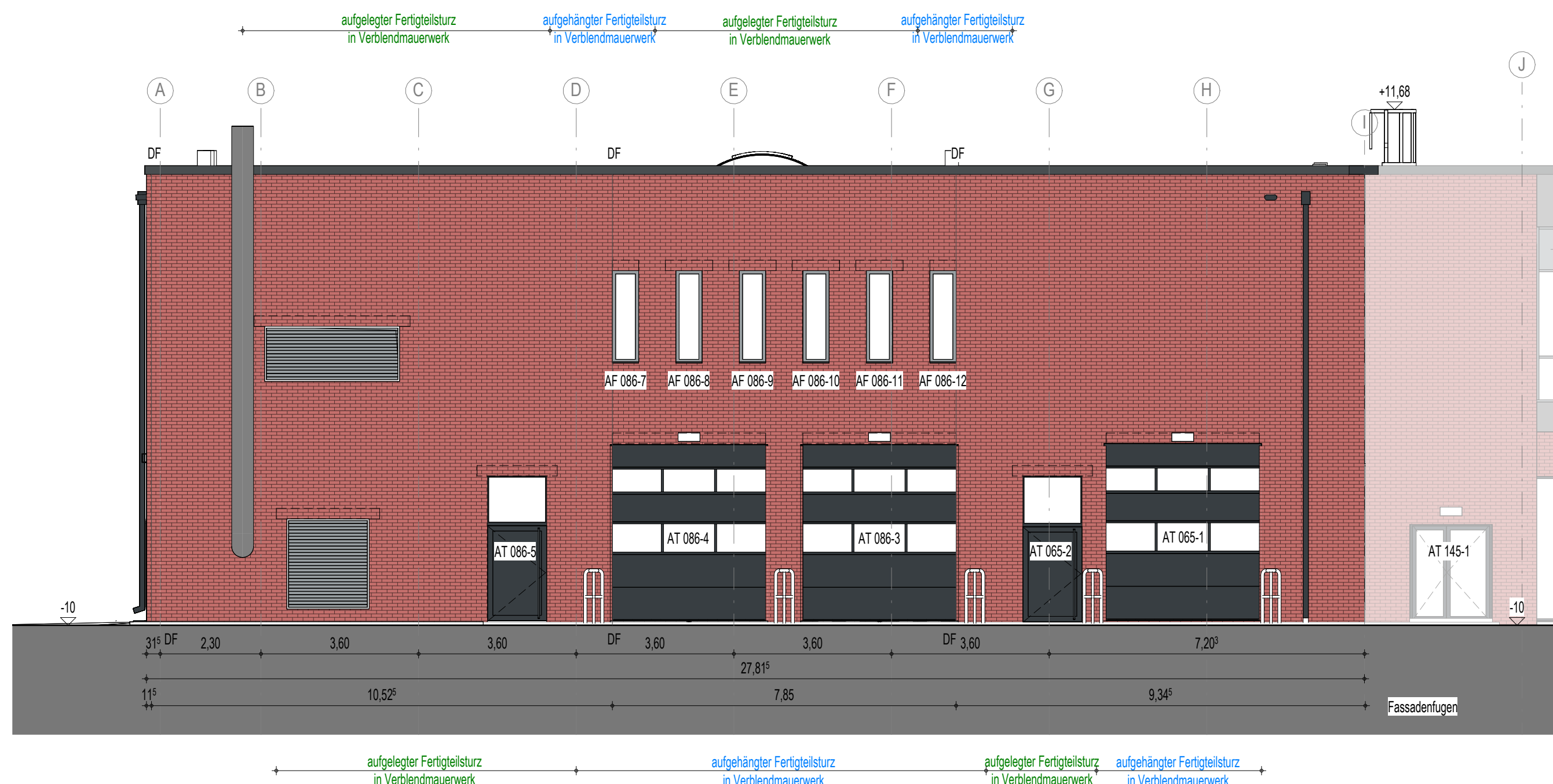
Ansicht BT 2 von Süden