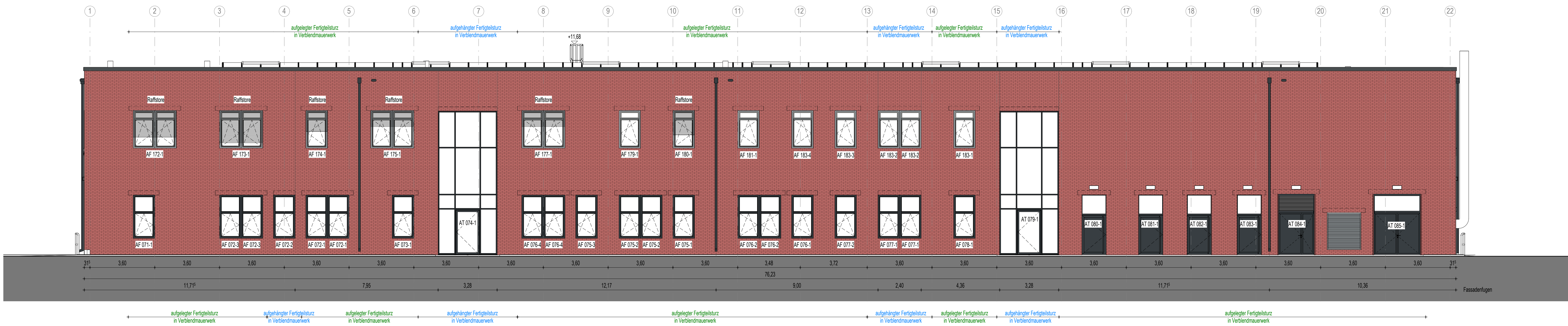
Ansicht BT 2 von Westen